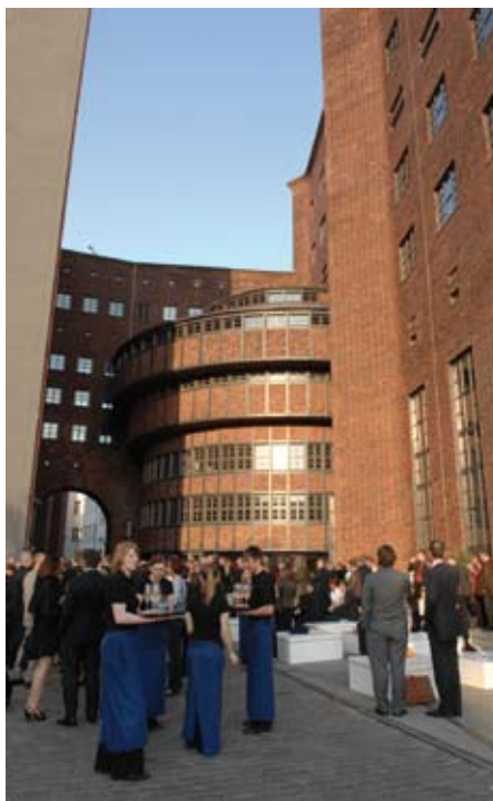
Das Berliner E-Werk lockte mit Sektempfang und strahlendem Sonnenschein

BFW-Abendveranstaltungen gelten generell als sehr beliebt. Der BFW Immobilien Kongress steht dieser Annahme in keinem Jahr aus. Ganz im Gegenteil – Der Immobilien Kongress und die Abendveranstaltungen werden von BFW-Mitgliedern ganz besonders angenommen. So auch in diesem Jahr.