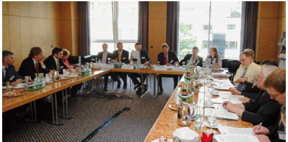
D.B. Die vollbesetzte Presselounge während des Pressegesprächs

an Wohnimmobilien eingegangen. Seniorennimmobilien würden in Zukunft den deutschen Immobilienmarkt zu einem Großteil dominieren. Deswegen müsse die Wirtschaft schon jetzt entsprechende Maßnahmen treffen, um dem wachsenden Bedarf rechtzeitig gerecht werden zu können. Von Seiten der Journalisten wurde das Gespräch positiv angenommen. Einzelne Gespräche im Nachklang und die Teilnahme in den Arbeitsgruppen zeigten dies. Auch für das kommende Jahr planen beide Verbände Pressevertreter zum Kongress einzuladen und sich wieder mit aktuellen Herausforderungen und Themen aus der Immobilienbranche zu beschäftigen.