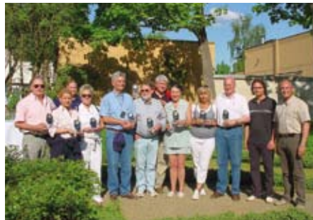
Die glorreichen Sieger des BFW-ista-Segelcups 2008

Bei anschließendem Barbeque hatten die Teilnehmer noch einmal die Gelegenheit, den BFW Immobilien Kongress Revue passieren zu lassen und sich auszutauschen. Das Wetter zeigte sich zudem von seiner besten Seite, sodass dann auch der Garten des Industrieklubs Potsdam ein Garant für