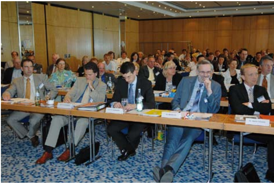
Auch die übrigen Referenten waren konzentriert bei der Sache

lige Partei in einem Mietverhältnis ein? Interessant für Immobilienverwalter war die Vorstellung verschiedener Perspektiven zu einem Thema.