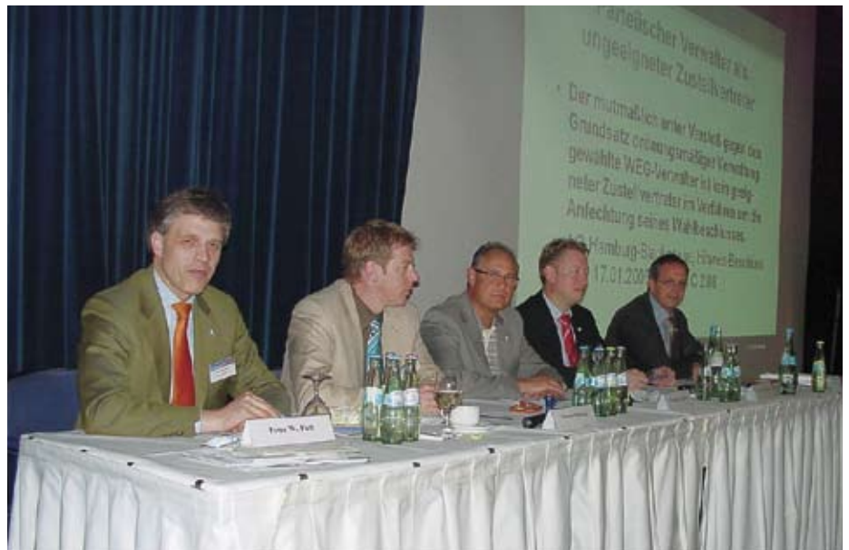
Der Vorstand des Bundesfachverbands Wohnungs- und Immobilienverwalter